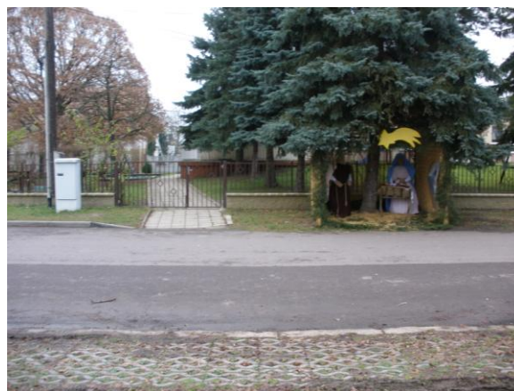
Plot kolem mateřské školy