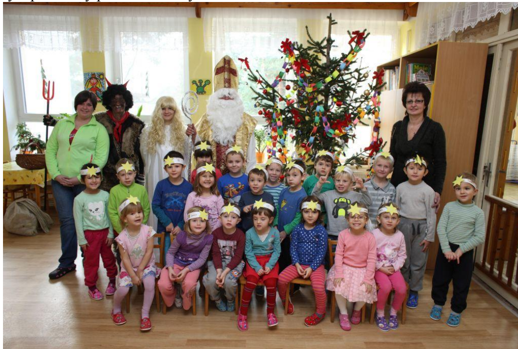
Mikuláš ve školce

Pro děti z mateřské školy Slup je toto předvánoční období časem tajemného očekávání a společných příprav na Vánoce. Jako každý rok si školičku vyzdobíme voňavými větvičkami jehličí s baňkami. Vyrobitme barevné papírové řetězy a vánoční ozdoby a jimi nazdobíme stromeček. Upečeme adventní kalendář z medového perníku. V sobotu 29. listopadu se ve Slupi již tradičně rozsvěcoval vánoční strom. Děti ze školky zde zapívali vánoční písně a koledy a přednesly pěkné básničky.