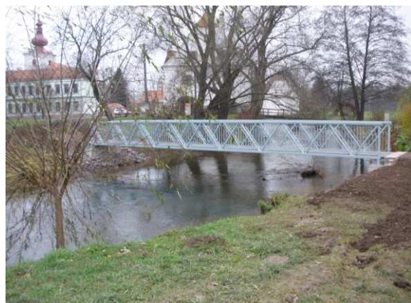
Lávka pro pěší přes náhon

Z investičních akcí došlo v posledních dnech k dokončení dvou staveb. V první řadě se jedná o rekonstrukci oplocení mateřské školy. Zde bylo nahrazeno staré zděné oplocení, novým ze štípaného ztraceného bednění a kovových dílců. Celkové náklady akce 430 000 Kč. K realizaci stavby bylo využito dotačního programu Jihomoravského kraje, který financoval projekt částkou 200 000 Kč. Dále došlo k rekonstrukci lávky pro pěší přes Dyjsko – mlýnský náhon. Lávka již nevyhovovala platným bezpečnostním předpisům a proto byla celá konstrukce lávky nahrazena novou moderní a bezpečnou mostovkou, zároveň byly rekonstruovány i betonové břehové opěry mostku. Celková cena se vyšplhala na cca 400 000 Kč.